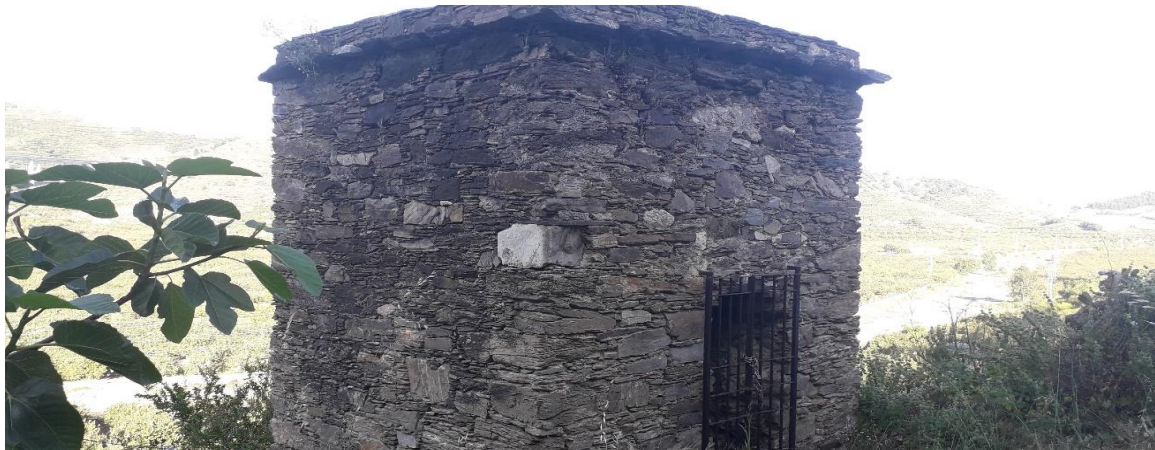
Ilustración 6. Vista noroeste sureste del Columbario de "Torre del Monje".

En su interior se compone de dos pisos superpuestos, donde se abren diez nichos dispuestos en dos filas de a cinco encargados de guarnecer las urnas cinerarias (Molina Fajardo et al, 1984, pp). Todo ello se encuentra rematado por una falsa bóveda de cañón sobre la que descansa un techo de lajas de pizarra que simulan una cornisa.