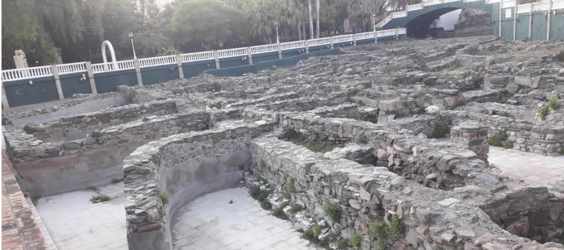
Piletas de salazón.