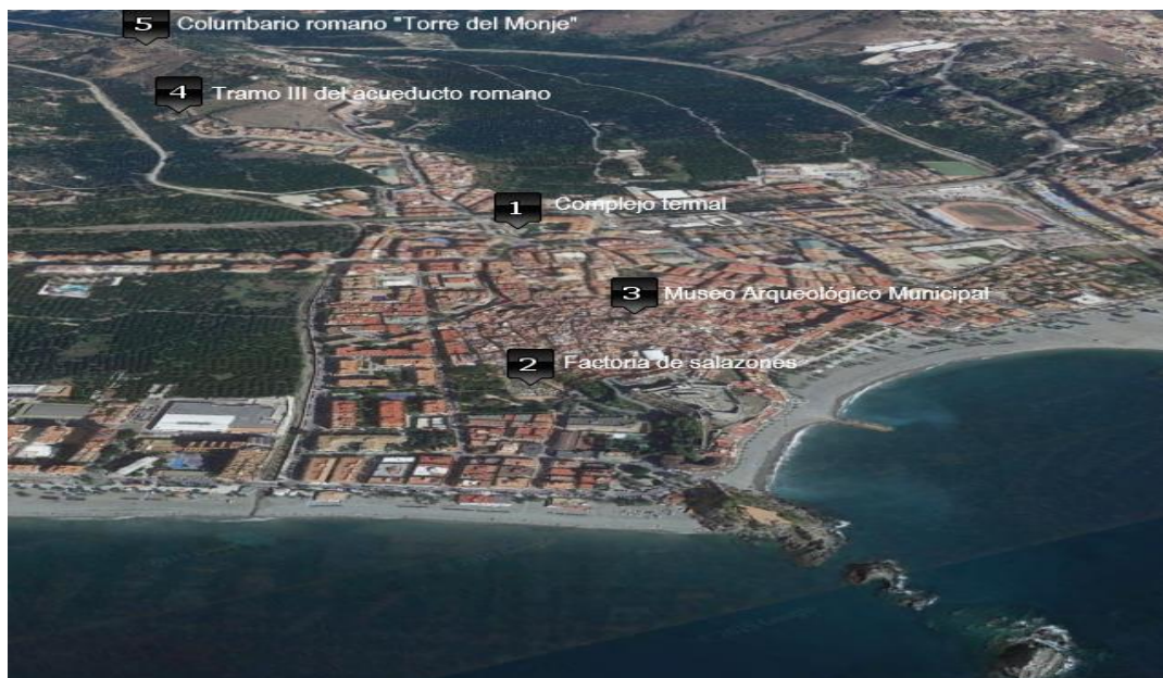
Ilustración 1. Mapa de los monumentos a visitar con nuestros alumnos.

Iniciaremos la visita con el complejo termal anexo al tramo IV del acueducto romano situado en la Calle “La Carrera de la Concepción”. Tras la breve explicación del mismo y una pequeña actividad planeada, pondremos rumbo a la factoría de salazones del Parque “El majuelo; a unos 20 minutos de distancia a pie. Tras mostrar los aspectos más importantes del mismo, elaboraremos un pequeño taller sobre el garum . Acto seguido continuaremos hacia el Castillo de San Miguel contiguo a la tercera explicación y actividad: el Museo Arqueológico Local “Cueva de Siete Palacios”.