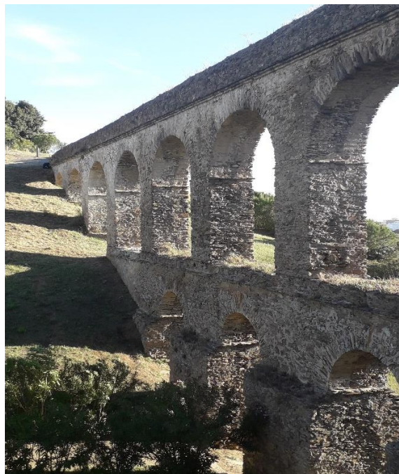
Acueducto Tramo III