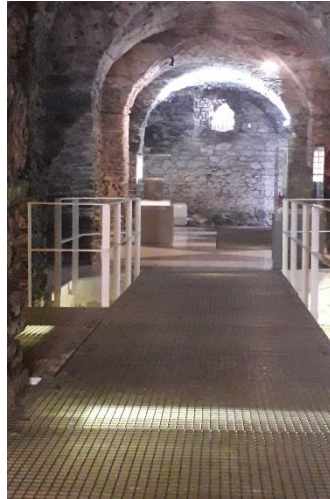
Interior Museo Municipal Almuñécar