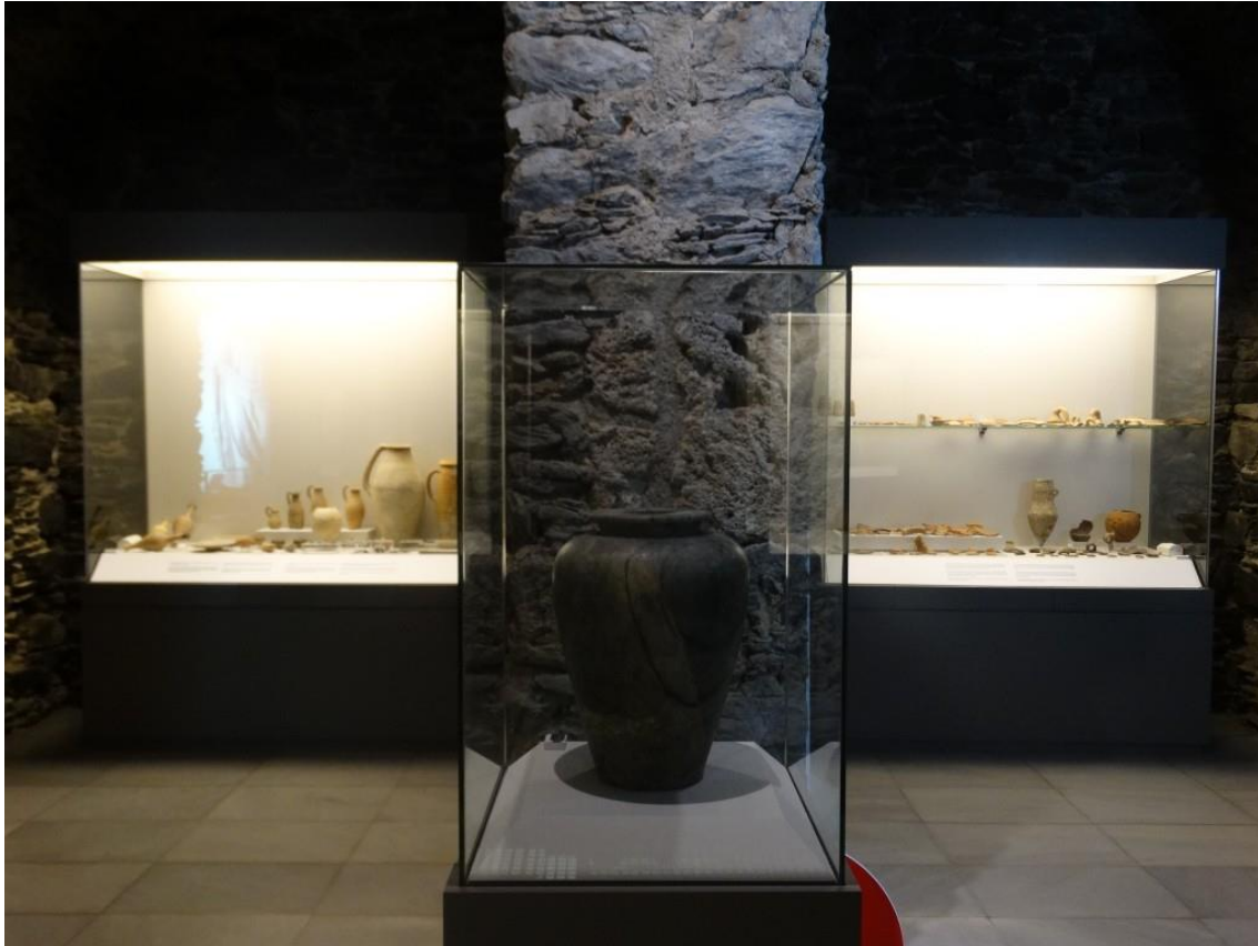
Ilustración 4. Vista del interior de la Cueva-Museo de Siete Palacios.