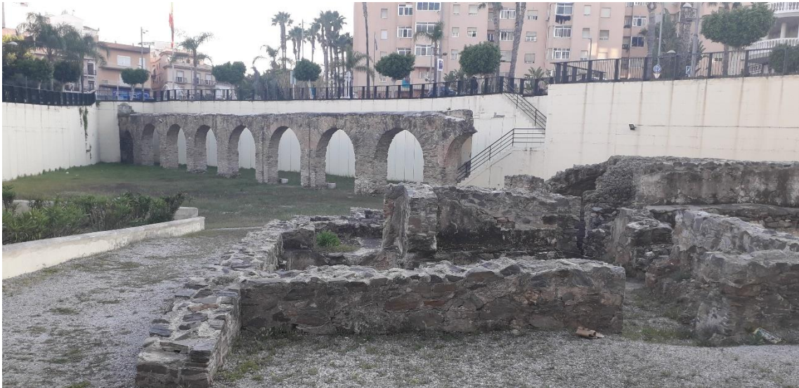
Tramo IV y termas.