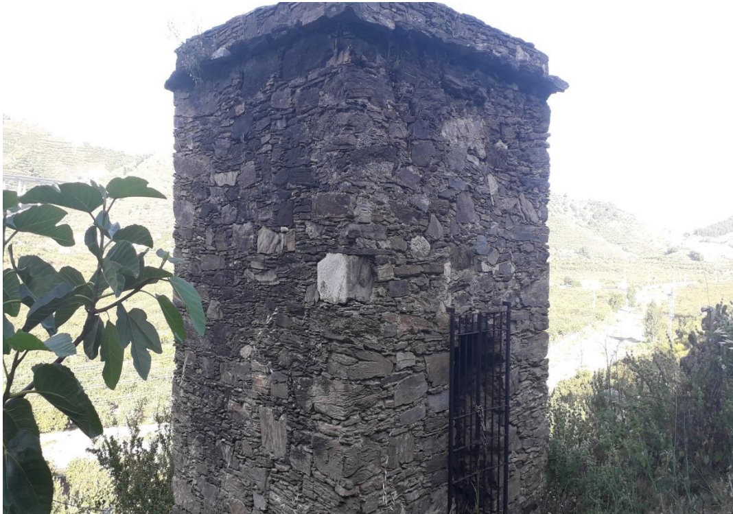
Columbario del río Verde denominado “Torre del Monje”