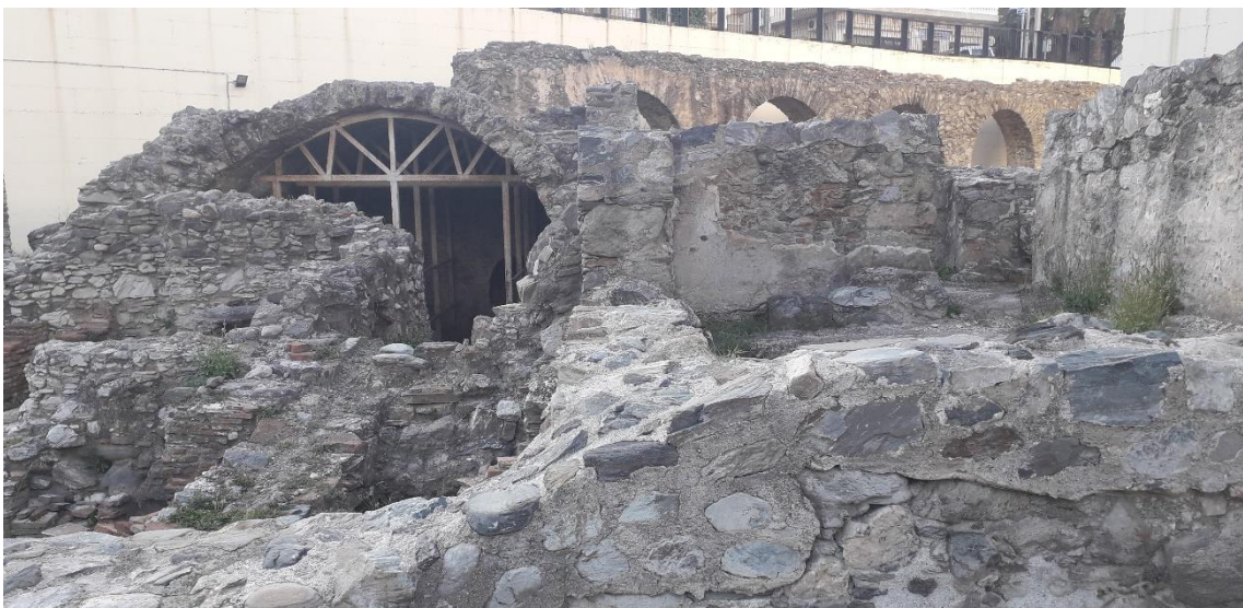
Termas. Fuente: Imagen Propia