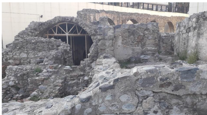
Ilustración 2. Las Termas Romanas de “La Carrera” en su fachada este.

Junto al famoso tramo cinco del venter del acueducto de la Calle de “La Carrera” se excavó a finales de siglo un complejo termal datado a finales de siglo I d.C. Este, situado extramuros, tenía un carácter público y poseía toda una serie de estancias destinadas al baño, relajación y encuentro de los ciudadanos acomodados (Burgos et al. , 2004, pp. 428- 434).