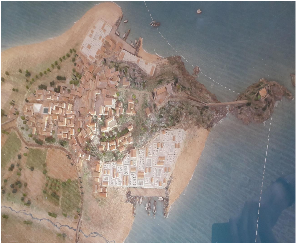
Reconstrucción Almuñécar romana.