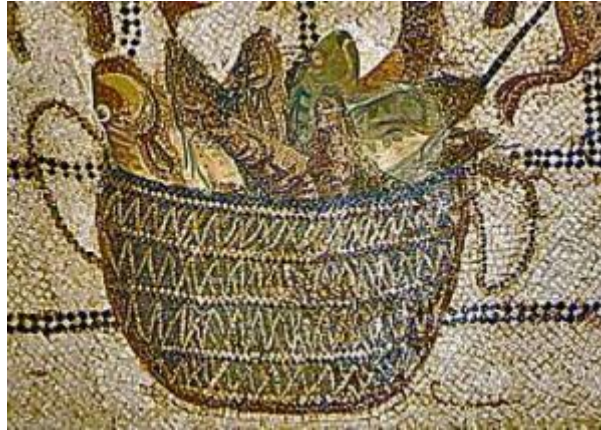
Figura 2. Mosaico de peces para elaboración de garum.