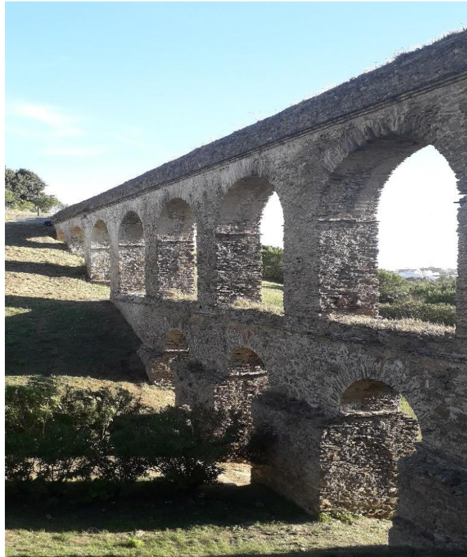
Ilustración 5. Acueducto III en sentido norte sur.

que las componen están construidas con materiales cuaternarios (cuarcitas y esquistos) y cimentadas con morteros aglutinantes de cal, para el exterior. y dolomita, para zonas en contacto con el agua.