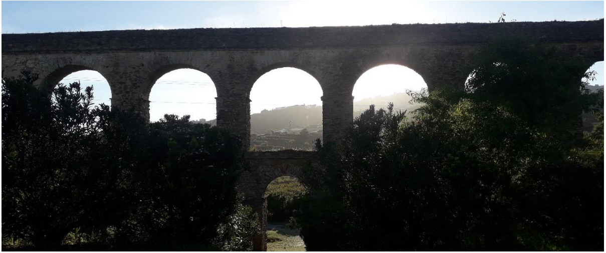
Acueducto Tramo III. Parque del Acueducto