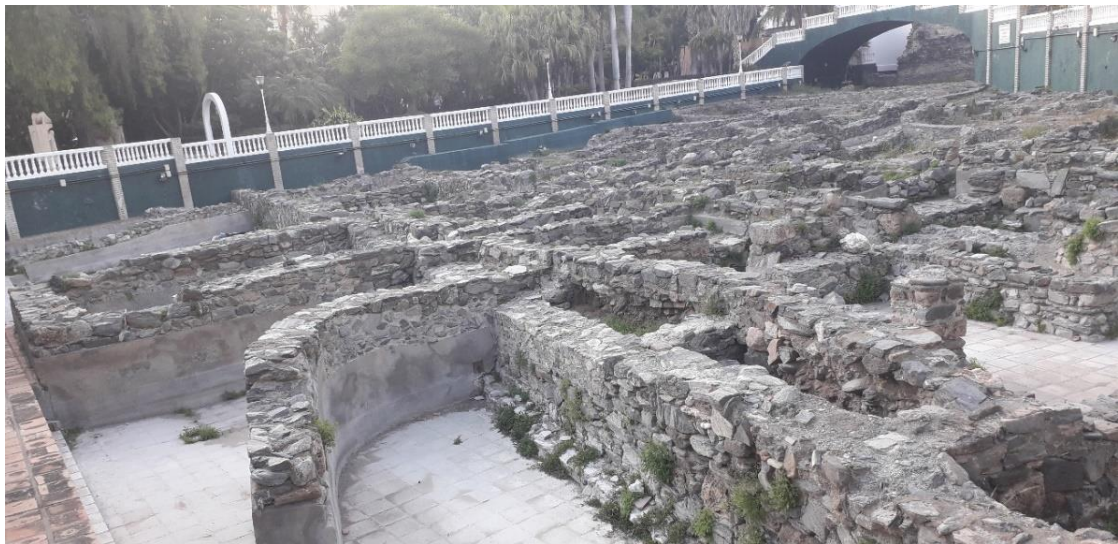
Ilustración 3. Sector sureste de las estancias administrativas y de procesado. Fuente: imagen propia